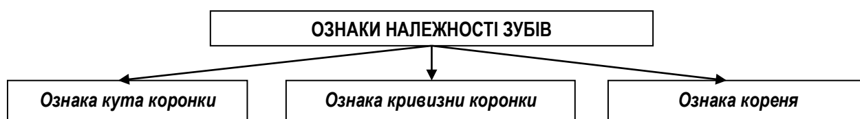
Схема 4.2. Ознаки належності зубів